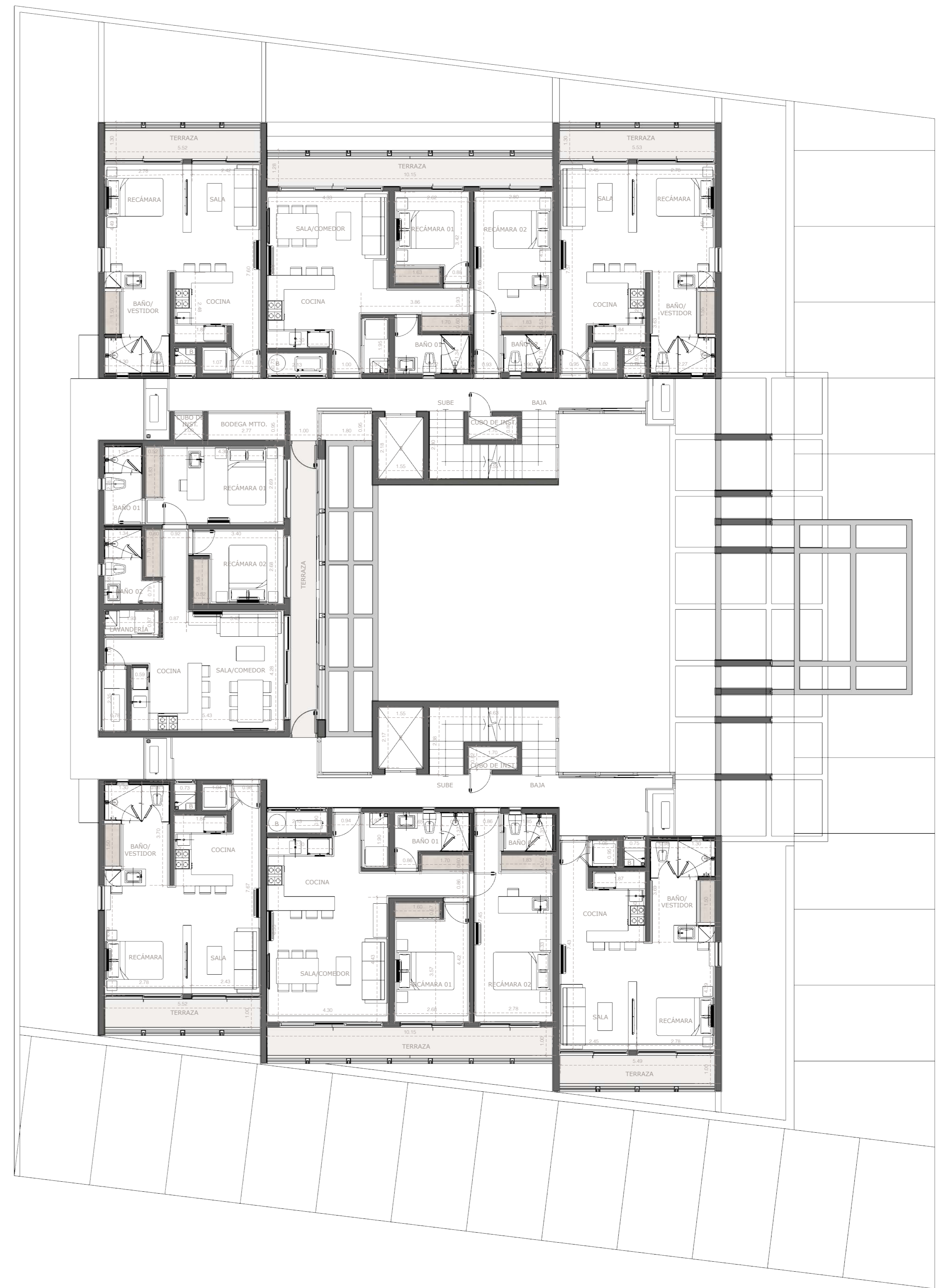
NIVEL 01 02 PROYECTO ARQUITECTÓNICO ESCALA 1:100