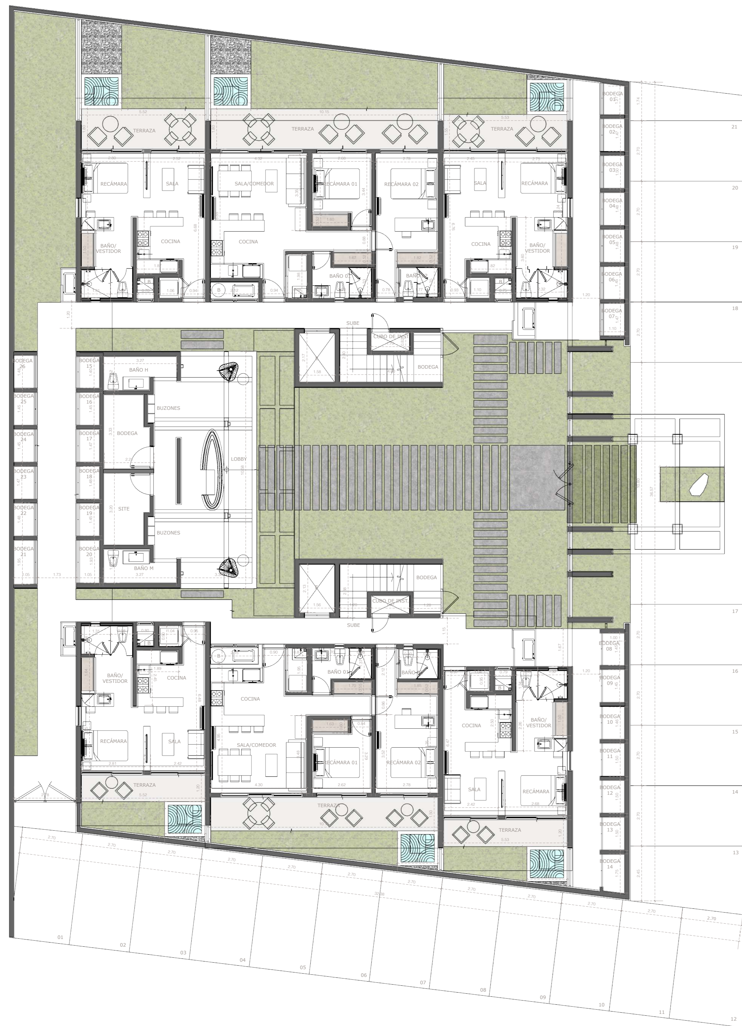
PLANTA BAJA 01 PROYECTO ARQUITECTÓNICO ESCALA 1:100