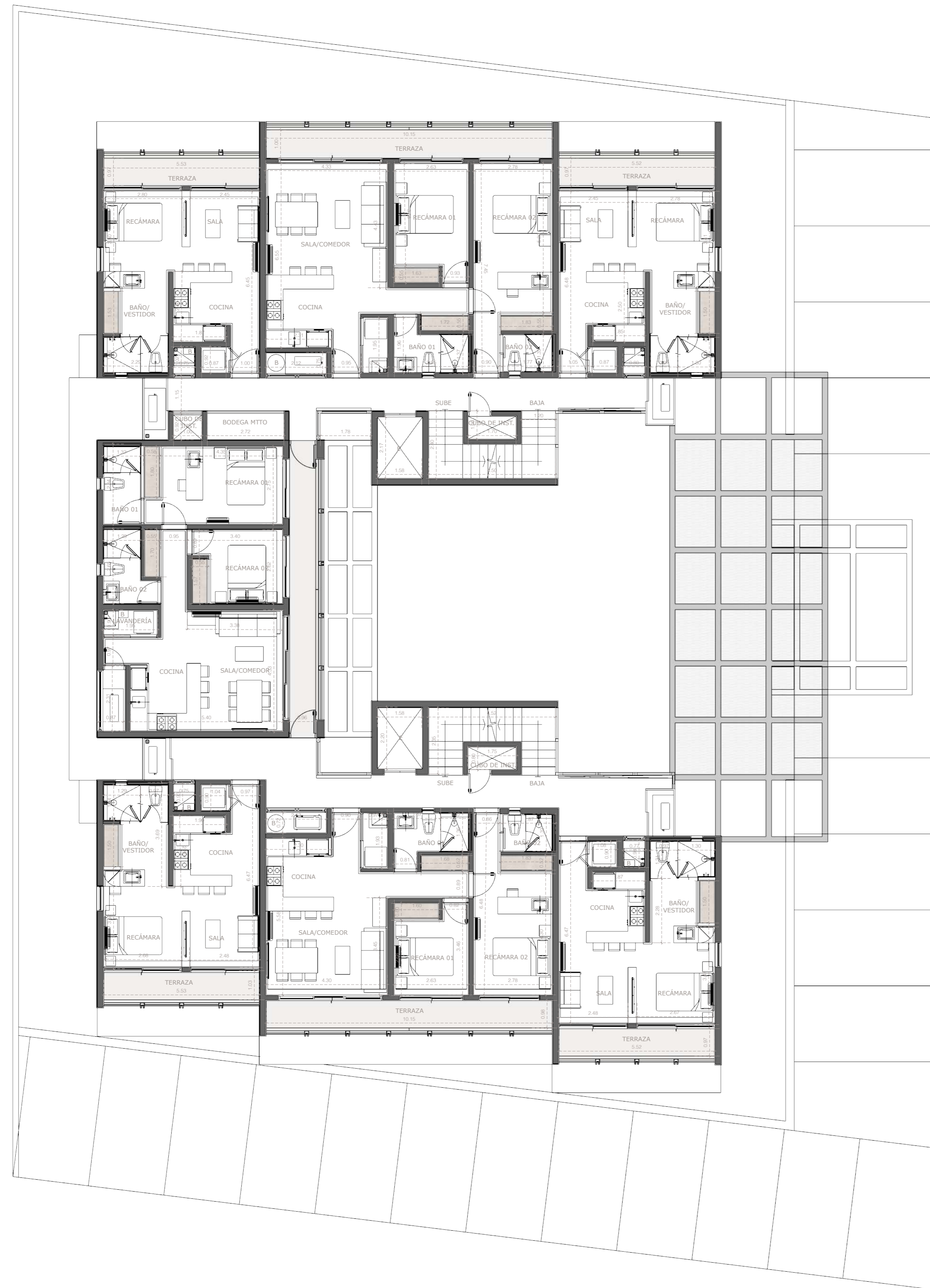
NIVEL 02 | 03 PROYECTO ARQUITECTÓNICO ESCALA 1:100