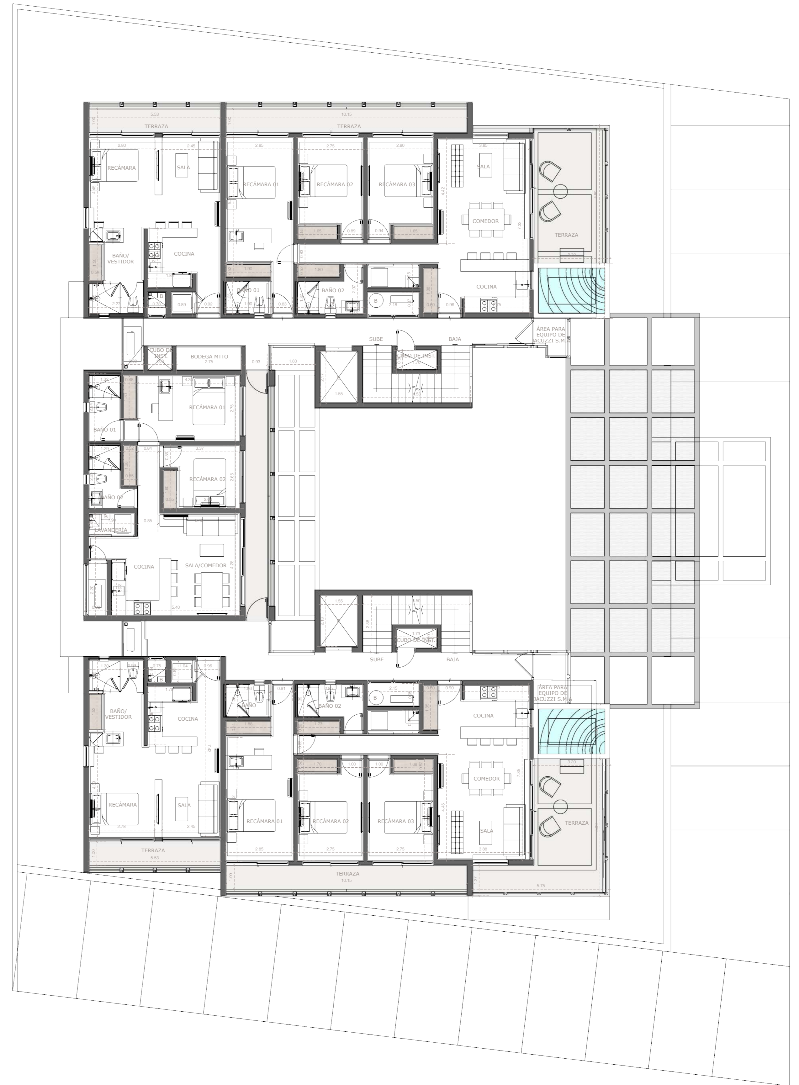
NIVEL 03 | 04 PROYECTO ARQUITECTÓNICO ESCALA 1:100